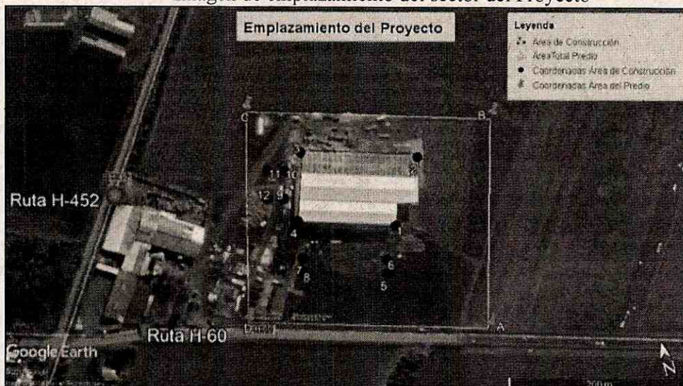
Imagen de emplazamiento del sector del Proyecto