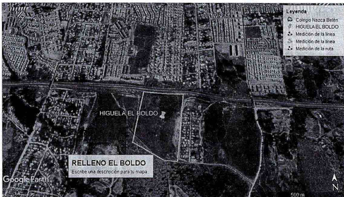
Figura N° 1, emplazamiento del Proyecto.