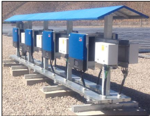
Imagen 1: Caseta de inversores

A continuación se muestran imágenes conceptuales de las instalaciones del proyecto: