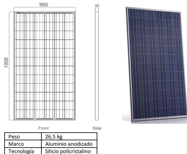
Imagen 6: Panel fotovoltaico