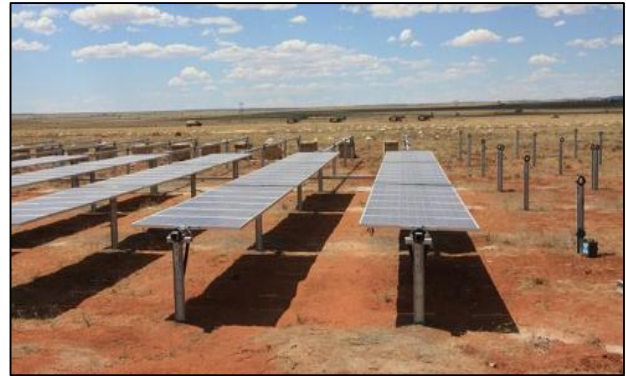
Imagen 2: Paneles fotovoltaicos montados sobre las estructuras de soporte hincadas en el terreno