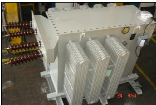
Imagen 5: Transformador de elevación trifásico de 0,4 / 13,2 kV – 1.8 MVA