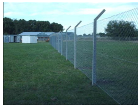
Imagen 4: Cerco perimetral