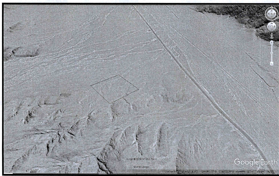
Imagen N° 1