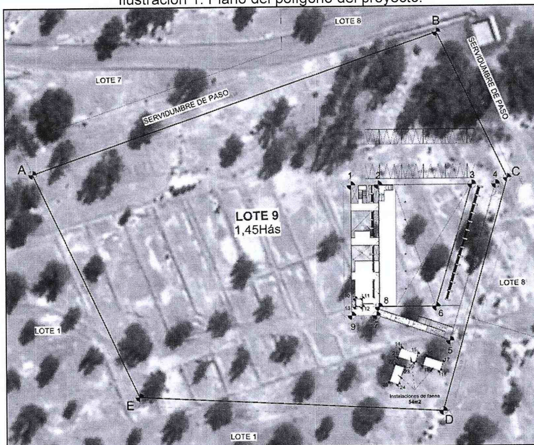
Ilustración 1. Plano del polígono del proyecto.