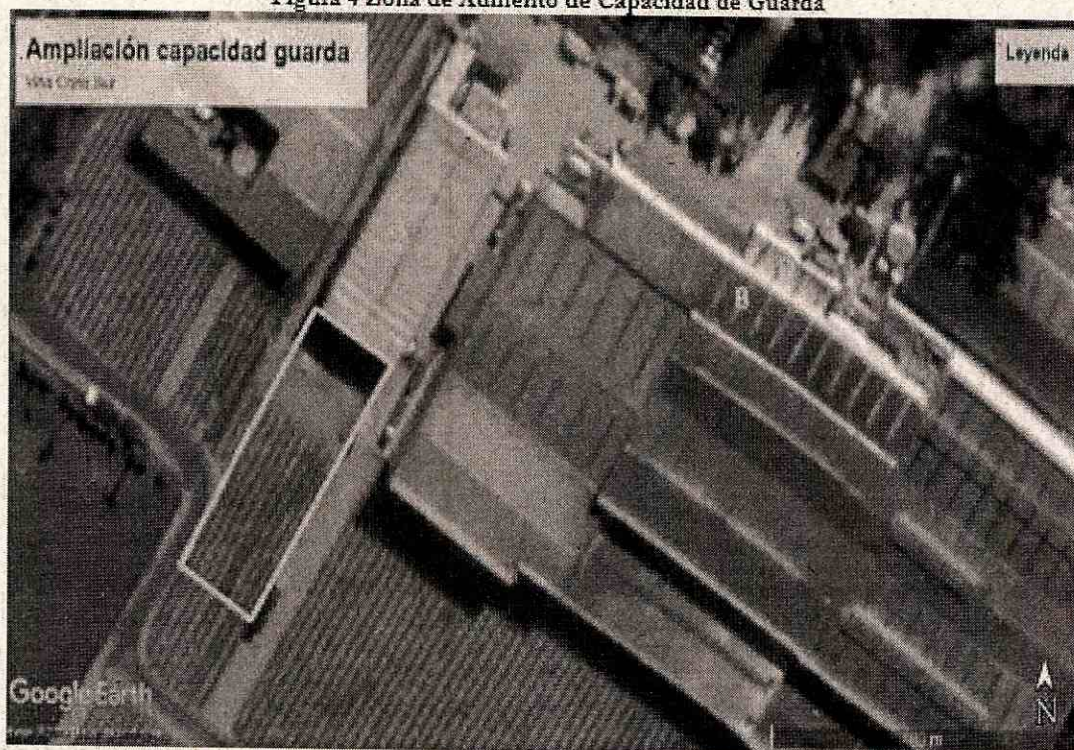
Figura 4 Zona de Aumento de Capacidad de Guarda

En la Figura 3. Croquis de Caracterización de Instalaciones Nuevas, y Figura 4 Plano de Aumento de Capacidad de Guarda, se muestra la caracterización referencial de las instalaciones que se localizarán en el área a ampliar de la Bodega de Vinos, siendo la letra e) la que representa las nuevas instalaciones objeto de la presente Consulta de Pertinencia.