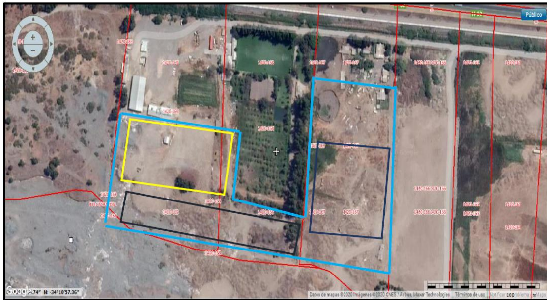
Figura N°4. Ubicación del Área de disposición de Residuos Industriales en relación a lo informado en la Res. N°184/2019