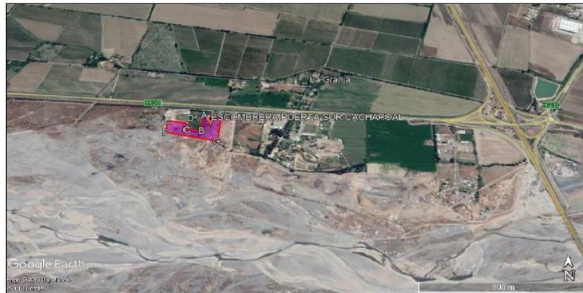
Figura N°1. Ubicación del Proyecto

Fuente: Figura N°4 de la Consulta de Pertinencia.