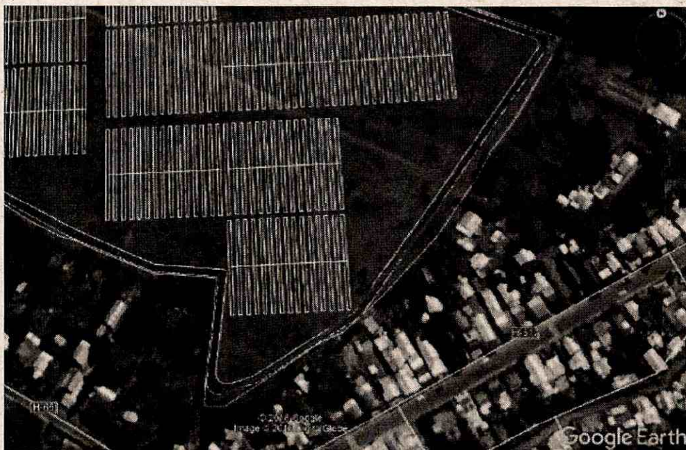
Figura N°1 de la carta individualizada en el Visto N°2 de la presente resolución.

La modificación del cambio de barrera natural por muro de concreto (pandereta) se realizará en el mismo sector en donde quedo establecido que se implementaría la barrera natural, correspondiente a la línea roja que se visualiza en la Figura 1 de la carta individualizada en el Visto N°2 de la presente resolución, en el sector este del Proyecto, el cual da hacia las viviendas de la localidad de La Chimba, abarcando una longitud aproximada de 310 metros, aproximadamente, tal como se presenta en la figura a continuación: