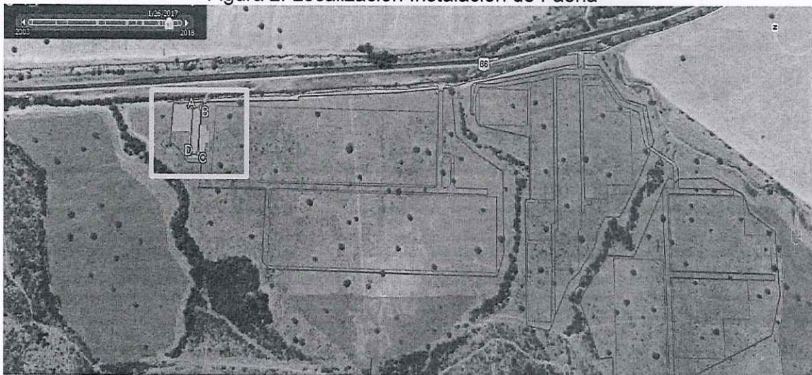
Figura 2: Localización Instalación de Faena

Fuente: Figura-1, de la presentación singularizada en el Vistos N°2