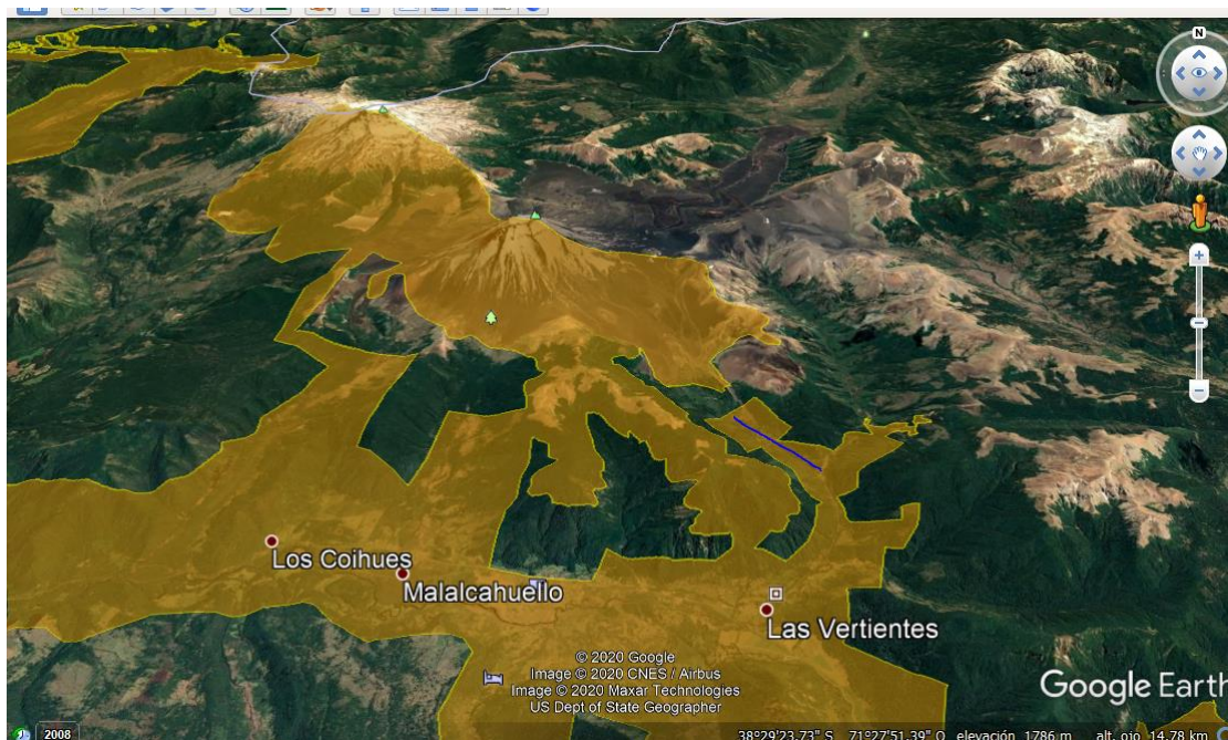
Figura 2. Imagen satelital de ZOIT Curacautín y la localización del proyecto.

2.2. Respecto a la construcción, se considera utilizar lo siguiente: