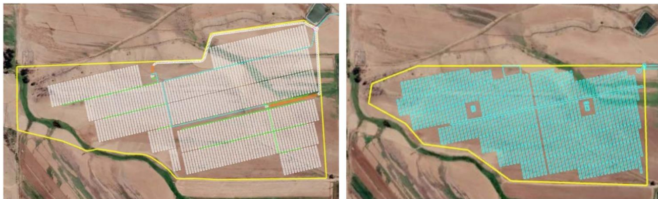
Figura 1: área del polígono original v/s la nueva área propuesta: