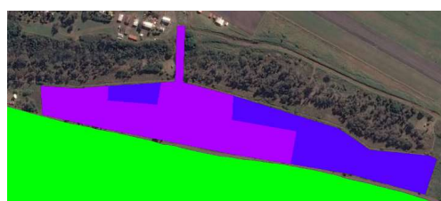
Imagen 2: limite PN Rapa Nui (verde) Imagen 3: Recursos arqueológicos.