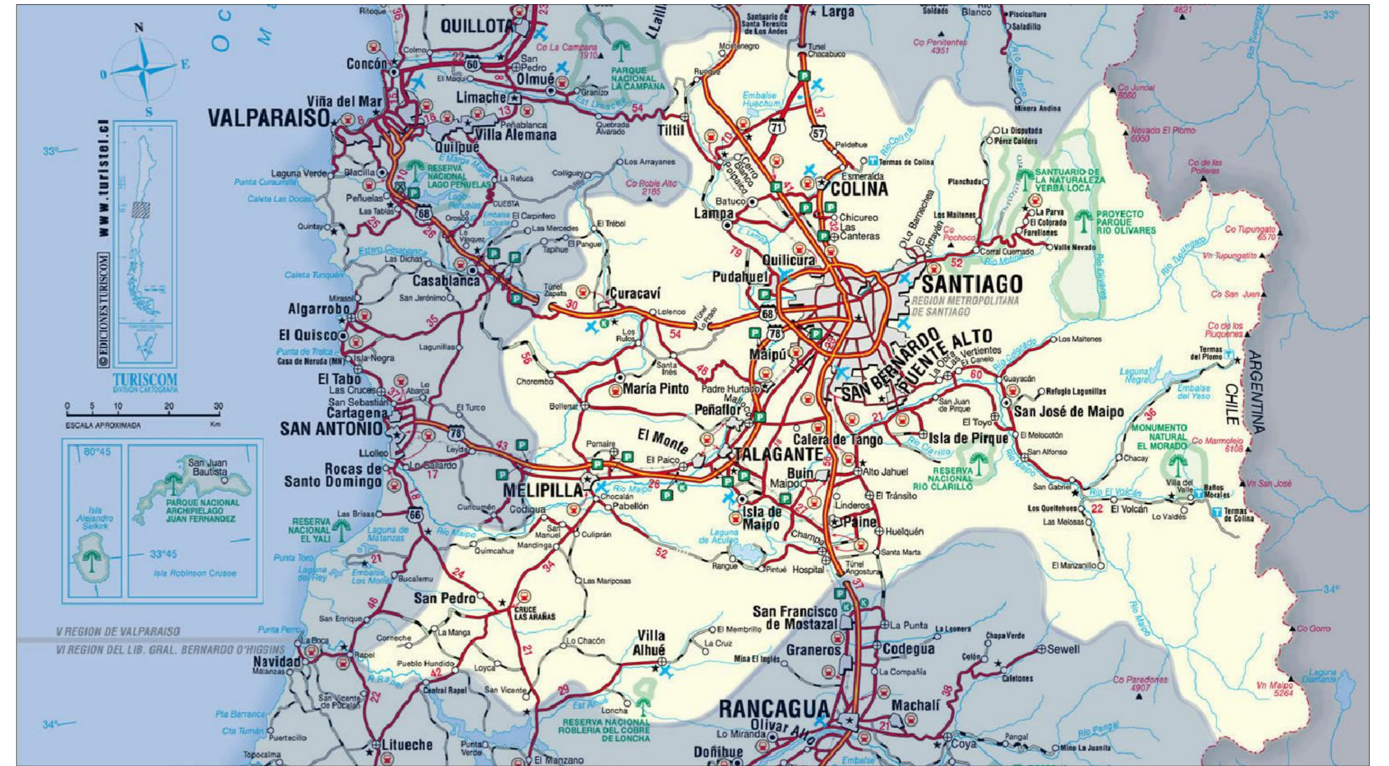
REGIÓN METROPOLITANA, REPUBLICA DE CHILE