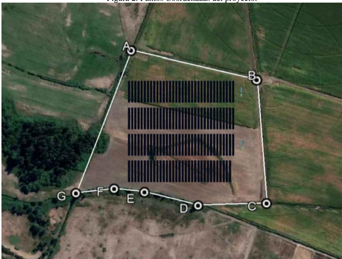
Figura 2: Puntos Coordenadas del proyecto.