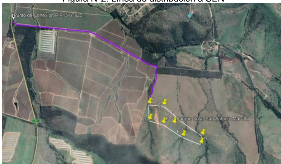
Figura N°2: Línea de distribución a SEN