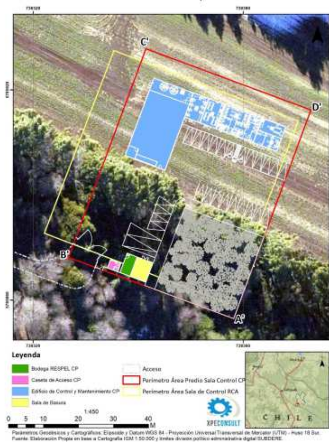
Figura 3 Nueva configuración de estructuras y edificaciones al interior del nuevo perímetro asociado a la Sala de Control y Mantenimiento