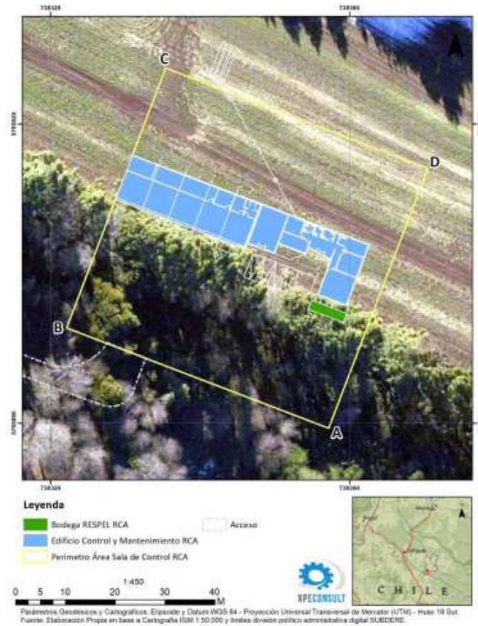
Figura 2 Estructuras y edificaciones al interior del perímetro definido para la Sala de Control y Mantenimiento RCA