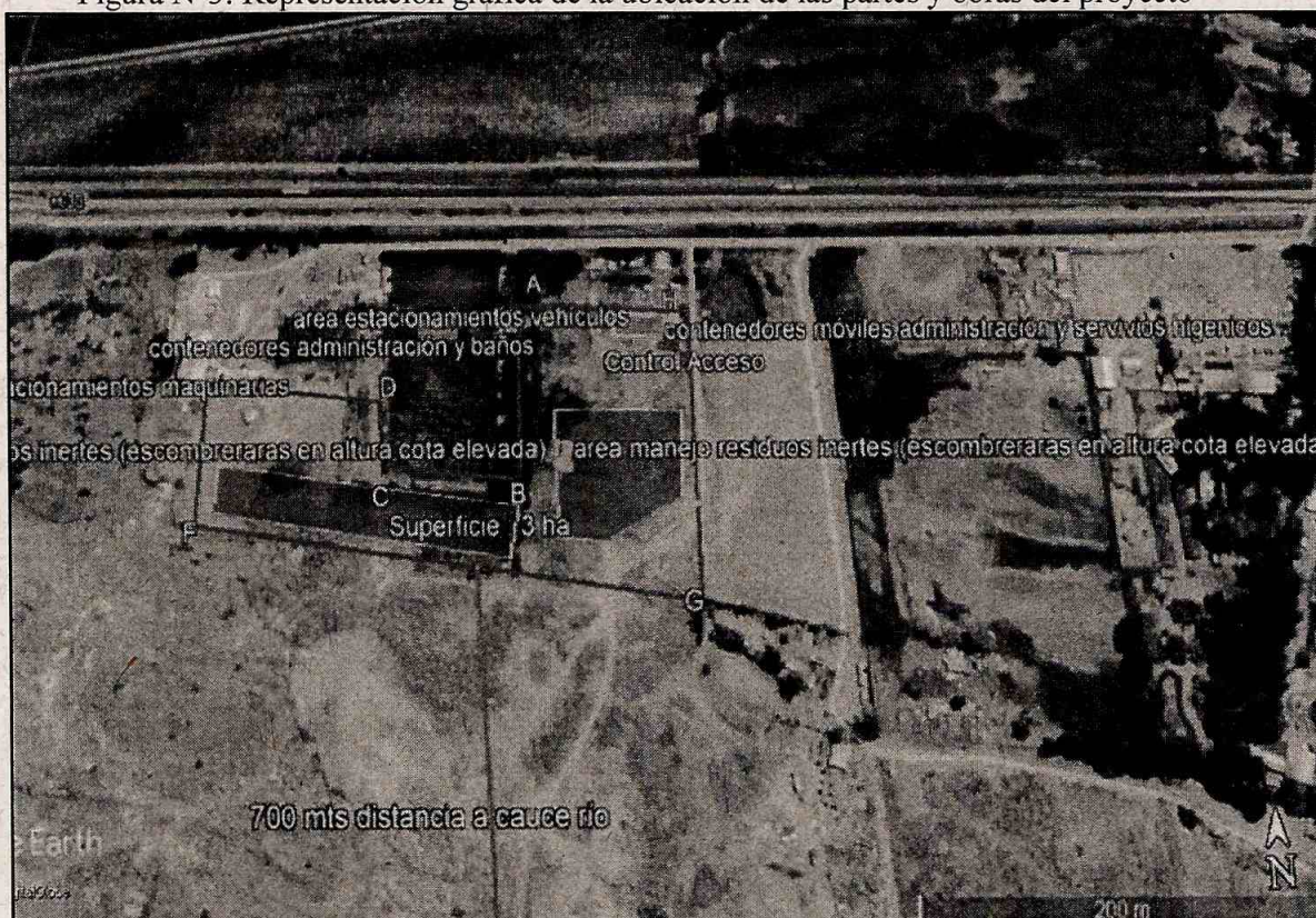
Figura N°3: Representación gráfica de la ubicación de las partes y obras del proyecto