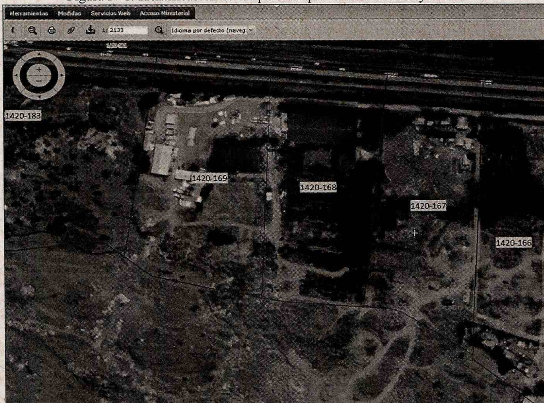
Figura N°1: Identificación de los predios que involucra el Proyecto