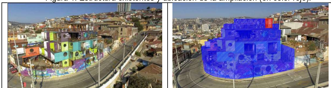
Figura 1: Estructura existentes y ubicación de la ampliación (en color rojo).