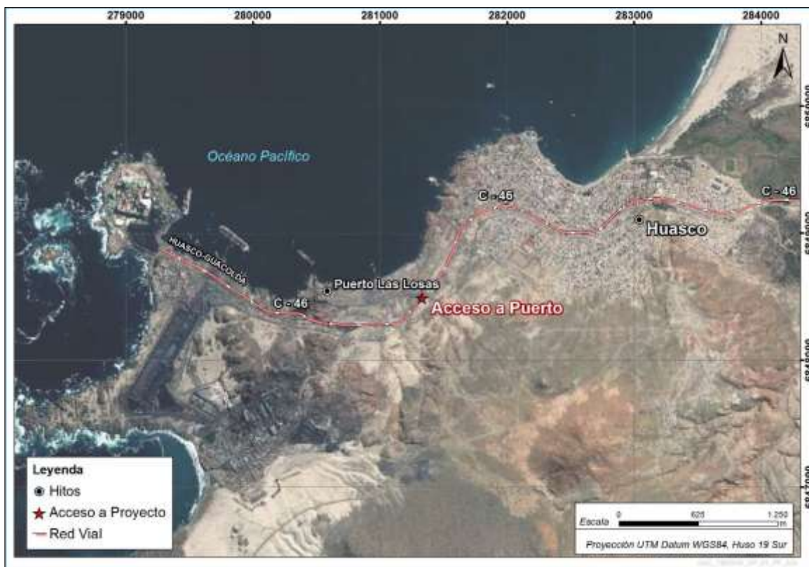
Figura 1 Ubicación General del Proyecto y Acceso