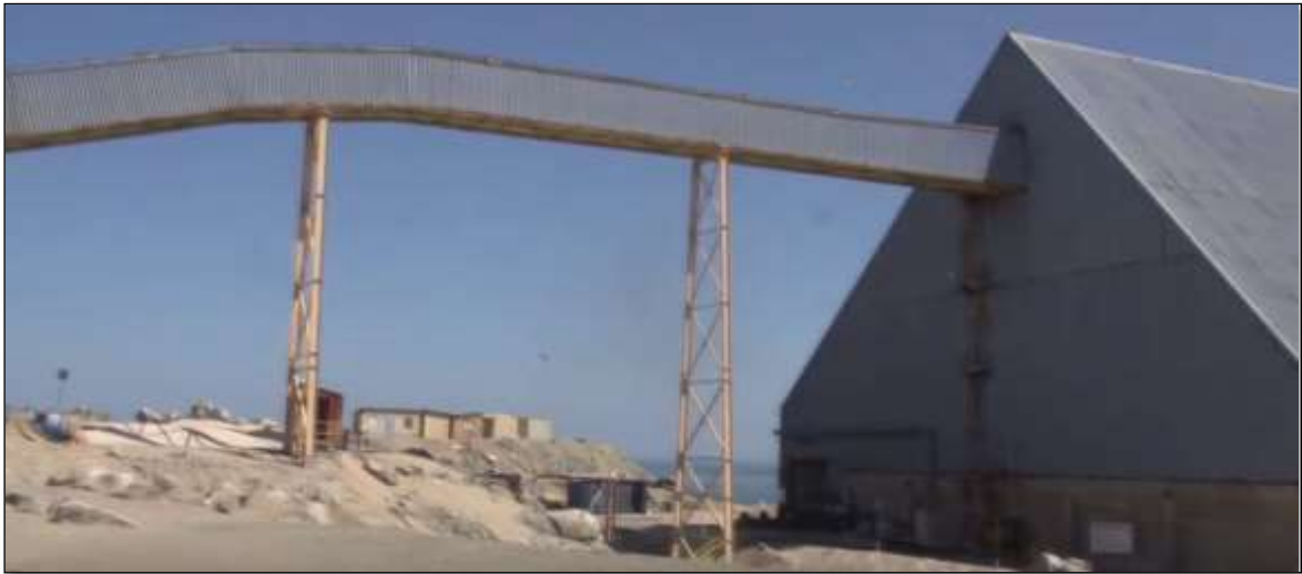
Figura 2 Imagen referencial de recepción de correa en edificio de almacenamiento de concentrado de Cu