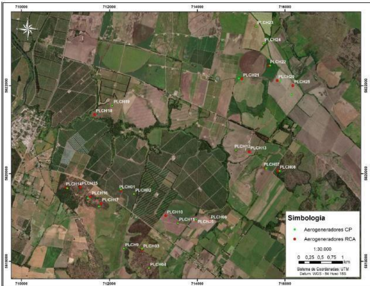
Figura N° 1. Comparación De ubicación de aerogeneradores entre Proyecto Original (RCA N° 143/2017) y Actualización del Proyecto (CP).

Respecto del modelo del aerogenerador es, lo aprobados en la RCA N° 143/2017, tiene altura de buje y largo de las aspas de un diámetro máximo de 136 m., y se cambia por uno Goldwind, modelo GW155-4,5MW, el cual tiene 155 m de diámetro máximo de aspas.