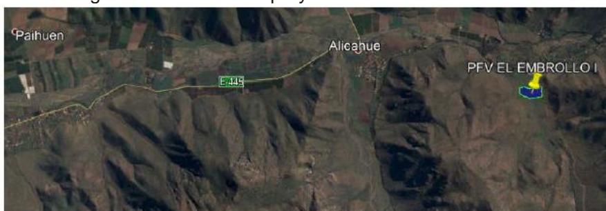
Imagen 1: Ubicación del proyecto fotovoltaico.