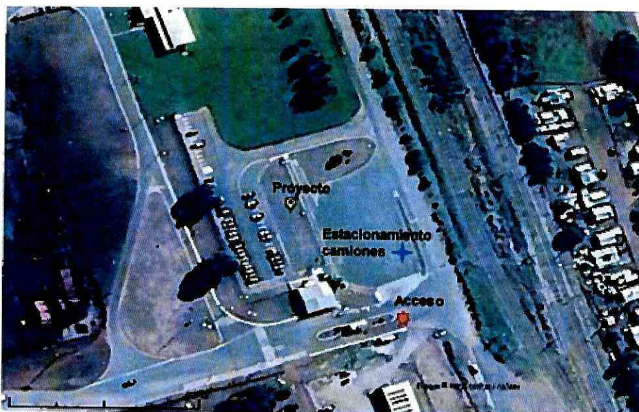
Figura 2 Ubicación de la Sala de descanso