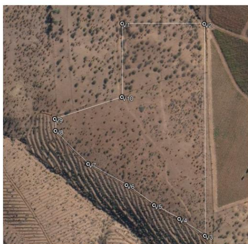
Figura N°1 Emplazamiento del proyecto.