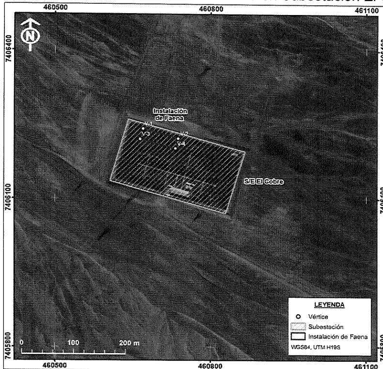
Ilustración 2. : Ubicación de Instalación de faena en Subestación El Cobre