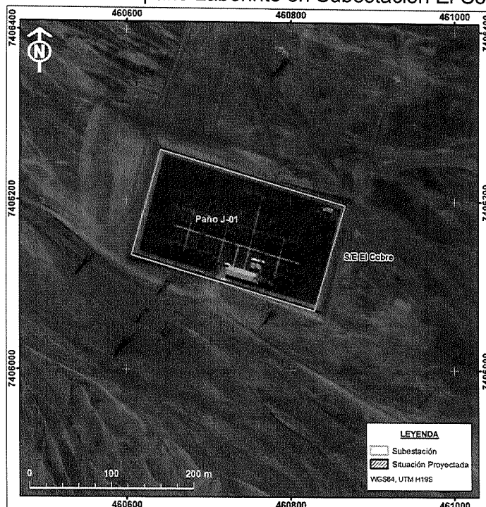
Ilustración 1. Detalle paño Laberinto en Subestación El Cobre