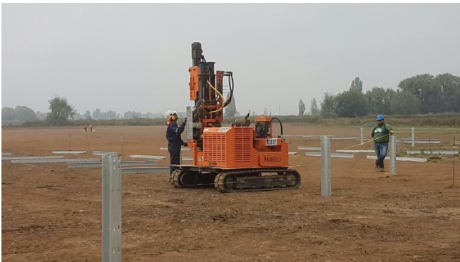
FIGURA 8: Hincado de estructuras de soporte

Las hincas que soportan a las estructuras de seguimiento de un eje (trackers), que sostienen a los paneles, son instaladas en terreno a través de martinetes hidráulicos, sin necesidad de incorporar hormigón en la base, ver figura 8. Una vez instaladas las estructuras de soporte y seguimiento en un eje (trackers), los paneles fotovoltaicos serán montados sobre éstas, se conectarán los componentes eléctricos entre los paneles y serán conducidos a los inversores instalados al frente de estos por medio de canalizaciones de al menos 60 cm de profundidad, ver figura 9.