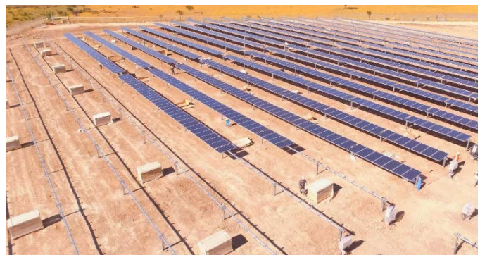
FIGURA 9: Instalación y montaje

Una vez terminada la construcción se procederá a limpiar las áreas intervenidas y desmontar la faena.