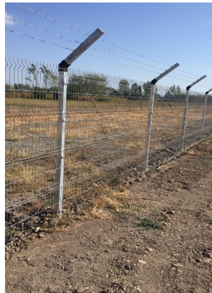
FIGURA 6: Cerco perimetral – Foto PFV Los Gorriones.