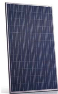
FIGURA 1: Paneles