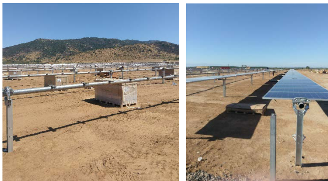
FIGURA 2: Paneles fotovoltaicos montados sobre las estructuras de soporte hincadas en el terreno, con seguimiento en un eje (diario, este-oeste) – Foto PFV Los Patos.